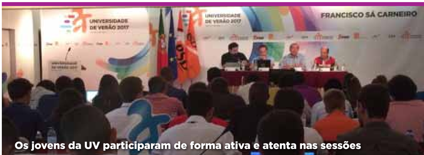
Os jovens da UV participaram de forma ativa e atenta nas sessões

DESAFIO É O EQUILÍBRIO ENTRE INOVAÇÃO, ECONOMIA E SUSTENTABILIDADE